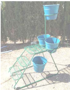
MODELO CONDOR CON ELEVADOR DE CUBO