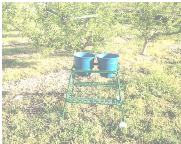
Metal - Vefra

C/ San Sebastián num. 1 bajos 22528 Alcarrás (Lleida) España Oficina: + 34 973795886 Fax: + 34 973795886 pedidos_metal@vefra.es