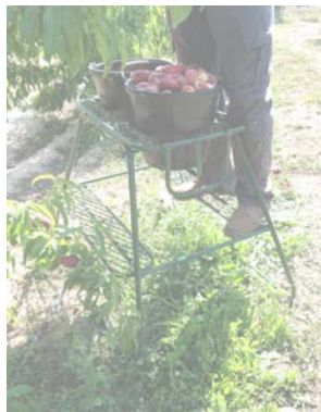
MODELO TIGRE CON SOPORTE 2 CUBOS