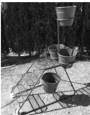
MODELO CONDOR CON ELEVADOR DE CUBO