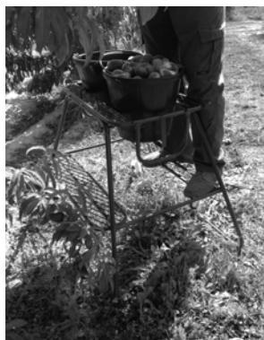
MODELO TIGRE CON 2 PORTACUBOS